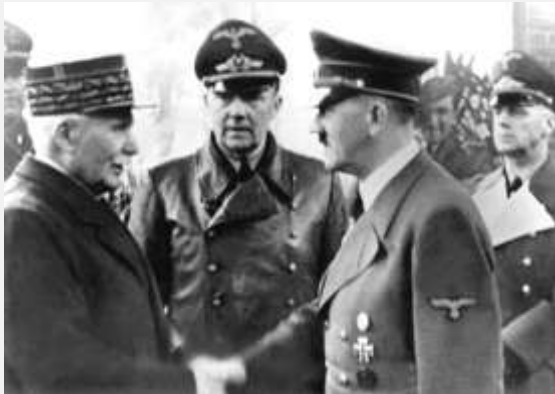
Poignée de mains symbolique entre Pétain et Hitler Montoire, 24 octobre 1940

→ EXTRAIT DU DOSSIER APOCALYPSE, TV5.ORG